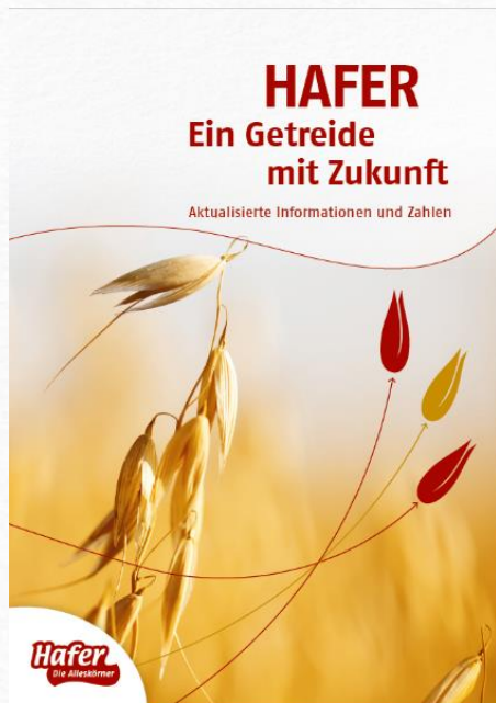
Broschüre 2019 Flyer 2024